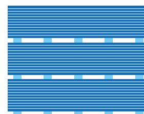
Figura 1: apilado de estibas